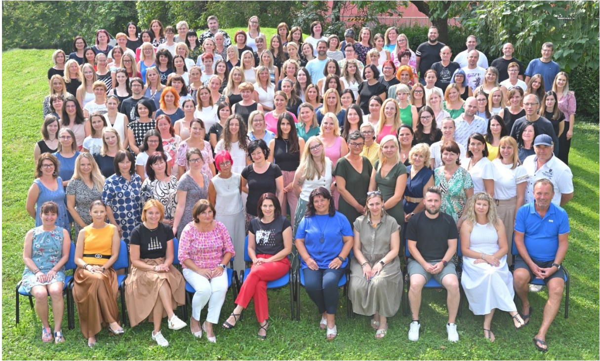
Slika kolektiva, avgust 2024